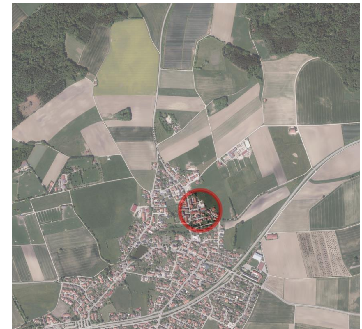
Lageplan o.M. Geobasisdaten © Bayer. Vermessungsverwaltung 01/2017.

Gemeinde Türkenfeld erlässt aufgrund §§ 2, 3, 4, 9 und 10 Baugesetzbuch – BauGB – , Art. 81 Bayerische Bauordnung – BayBO – und Art. 23 Gemeindeordnung für den Freistaat Bayern – GO – sowie aufgrund der Baunutzungsverordnung – BauNVO, in der Fassung der Bekanntmachung vom 21. November 2017 (BGBl. I S. 3786), die durch Artikel 2 des Gesetzes vom 14. Juni 2021 (BGBl. I S. 1802) geändert worden ist -, diesen Bebauungsplan als Satzung.