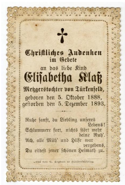
Sterbebild mit geprägter Spitzenimitation. Die Verstorbene ist ein fünfjähriges Kind.