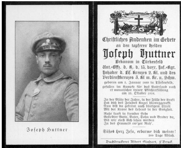
Clapboard from the first World War, still with Christian cross symbolism. Representation of life data and military career.