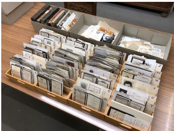
Death photo collection in the community archive Türkenfeld