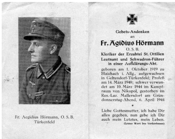
Clapboard from the second World War for a withdrawn Benedictine from St. Ottilien. The Christian cross is replaced by an iron cross with a hooked cross on top.