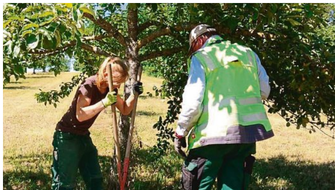
Voller Einsatz: die Mitglieder des OGBV haben Schilder für interessierte Obstliebhaber aufgestellt.