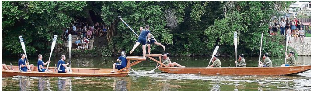
Die Wikinger der Freiwilligen Feuerwehr Oberdrauburg im Stechen mit dem Siegerteam, der AH-2.0 vom TSV Türkenfeld.

Bei dem französischen Fischerstechen fahren zwei Boote, von gegenüberliegenden Ufern in flottem Tempo aufeinander zu. Die mit langen Holzlanzen bewaffneten Stecher versuchten, sich gegenseitig vom Podest am