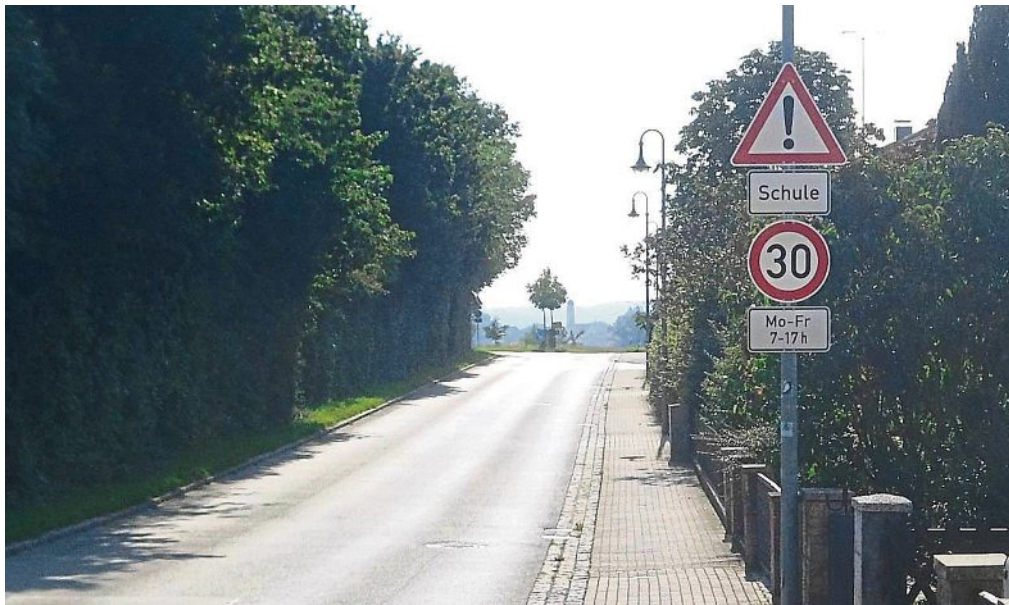
Zum Schutz der ABC-Schilden: entlang der Schule wurde ein Tempolimit eingerichtet.

In der Zeit vom 23. April bis zum 31. Mai hatte die Öffentlichkeit die Gelegenheit, sich