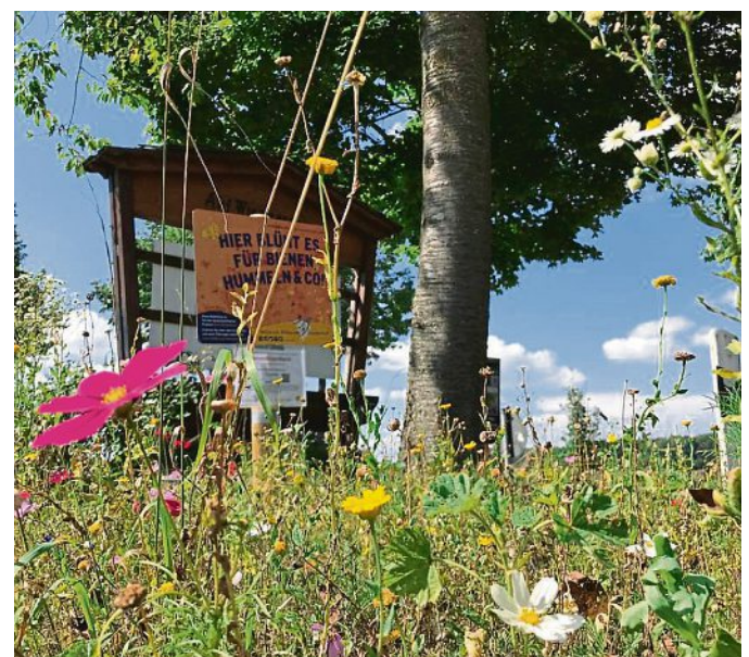
So schön blüht es in Türkenfeld: Gemeinsam mit dem Netzwerk „Blühende Landschaft“ wurden im Frühjahr auf etwa 1200 Quadratmetern mehrjährige Blümmischungen angesät. Das Ergebnis kann sich sehen lassen, an vielen Stellen im Gemeindegebiet blüht es herrlich. Diese Blühstreifen dienen nicht nur als Nahrungsquelle für unsere Insektenwelt, es ist auch eine Augenweide für alle Naturliebhaber und Blumenfreunde.

wieserKüchen, Zadarstr. 6a, 82256 Fürstenfeldbruck, Tel. 08141 26001, www.wieser-kuechen.de