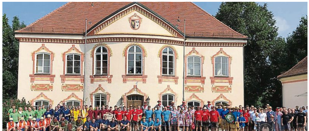
Großer Andrang: Alle Mannschaften beim Gruppenbild vor dem Rathaus.

„Zum Unterwirt“ Gasthof Hartl | Düringstr. 5 | 82299 Türkenfeld | Tel. 0 81 93/99 95 17 | kontakt@gasthof-hartl.de Besuchen Sie uns auch gerne auf unserer Homepage: www.gasthof-hartl.de