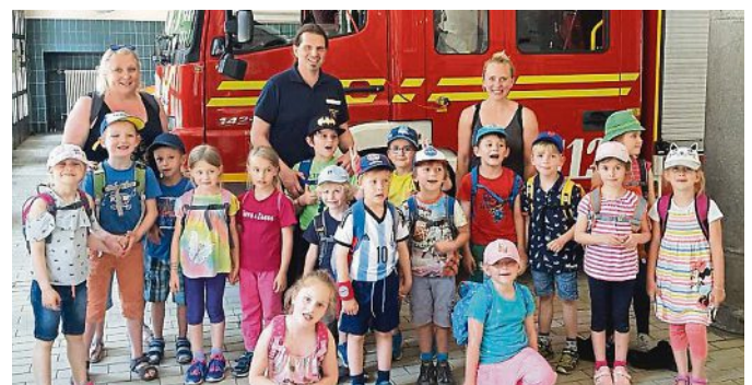
Zu Besuch bei Freund und Helfer: Die Kinder besuchten sowohl die Feuerwehr in München als auch Polizei.

Das Forscherteam möchte sich auf diesem Wege noch einmal herzlich für die offene und freundliche Bereitschaft aller beteiligten Organisationen bedanken. Nur so konnte die Projektwoche zu einem solch spannenden Ereignis werden.