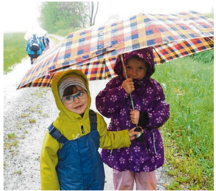
Die nasse Seite der Natur konnten diese beiden Kinder erleben.

Im Sommer erkundeten sie einen Bach und schauten sich verschiedene Krabbeltiere in einer Becherlupe an. Auch das Sommerfest Ende Mai war passend zum Thema gestaltet. Die Krippenkinder waren als Ameisen verkleidet und bildeten eine lange Ameisenstraße, die in einen Wald führte. Dort war viel Müll, den sie zuerst in Eimer sortierten, um dann ihren Ameisenhügel bauen zu können. Die Kindergartenkinder tanzten und sangen zu dem Lied „Beim Sommerfest auf der Wiese“, bei dem verschiedene Krabbeltiere vorkommen. Für die Kinder und Fachkräfte geht so ein spannendes und erlebnisreiches Jahr zu Ende.