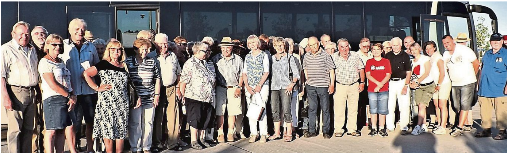
Verbrachten einen schönen Ausflugstag in der fränkischen Schweiz: die Teilnehmer des VdK-Ausfluges nach Pottenstein.