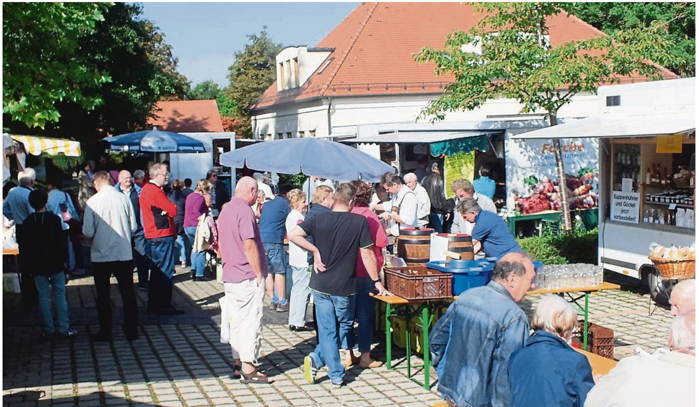
Jubiläumsfeier: der Wochenmarkt und das Herbstfest erfreuen sich jedes Jahr großer Beliebtheit.

auch dieses Mal nicht fehlen, denn die Bereitschaft mitzuwirken ist sehr groß: