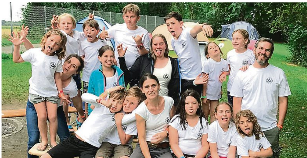
Hatten sichtlich Spaß am Zeltlager: die Teilnehmer am Programm des Kinder- und Jugendfördervereins.

Die folgenden Tage liefen dann so ab, dass drei leckere Mahlzeiten angeboten wurden und die verschiedenen Dienste mithalfen die Tische herzurichten, Obst oder Gemüse zu schnippeln oder das Abwaschwasser zu holen. Zwischendrin gab es Freizeit mit vielen verschiedenen Spielen wie Federball, Diabolos und Jongliertellern, auch die Kletterbäume wurden