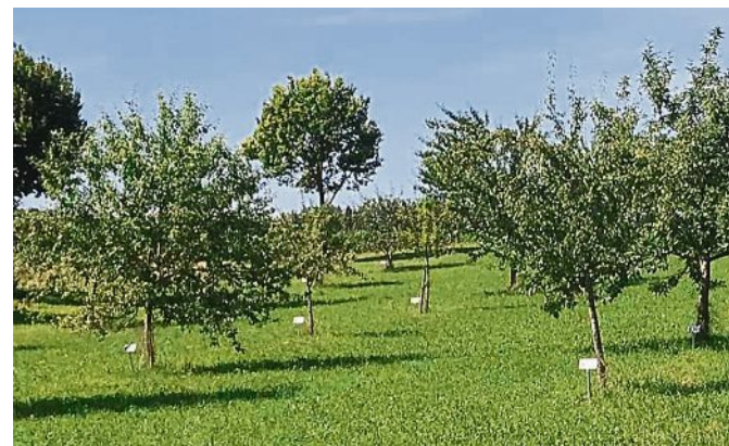
Früchteparadies: die 2007 gepflanzten Obstbäume.