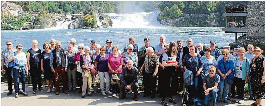
Genossen den Ausflug sichtbar: die Reisegesellschaft in Schaffhausen.

Zwar nieselte es noch, als die 78 Teilnehmer des Ausflugs früh morgens vom Maibaum in Türkenfeld am 16. September losfuhren. Aber bei der Ankunft in Straßburg/Strasbourg, der Hauptstadt des Elsass, herrschte schönsten Herbstwetter. Die Reisegruppe enterte zwei Stadtbähnchen und unternahm eine 45-minütige Rundfahrt durch die Altstadt. Viele der Reiseteilnehmer nutzten nach der Rundfahrt die Zeit bis zur Weiterfahrt der Busse zu den Hotels nach Freiburg zu einem Besuch des gotischen Liebfrauenmünsters (Cathé-