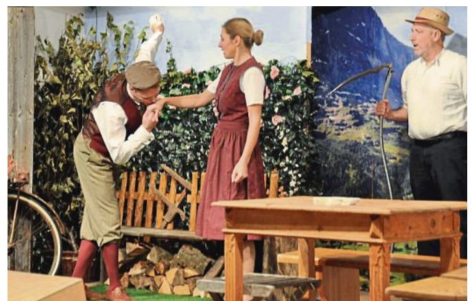
Da blieb kein Auge trocken: die Duringfelder Theatergruppe.

Viel Arbeit steckt drin, bevor es dann zum ersten Mal heißt: „Vorhang auf!“ Als endlich das richtige Stück ge-