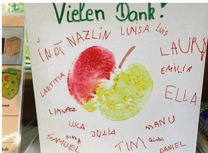
Dank für das viele Obst: die Kinder bedankten sich herzlich beim OGBV mit einem selbstgemalten Schild.

Die Saison 2018 wird als ein Rekord-Apfeljahr in die Annalen eingehen. Bundesweit rechnet man mit einem Ernteertrag von 1,1 Millionen Tonnen Streuobstapfeln.