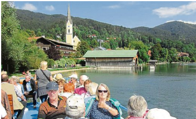
Eine Seefahrt, die ist lustig: Die Mitglieder des VdK-Ortsverbandes auf der Schlierseerundfahrt.