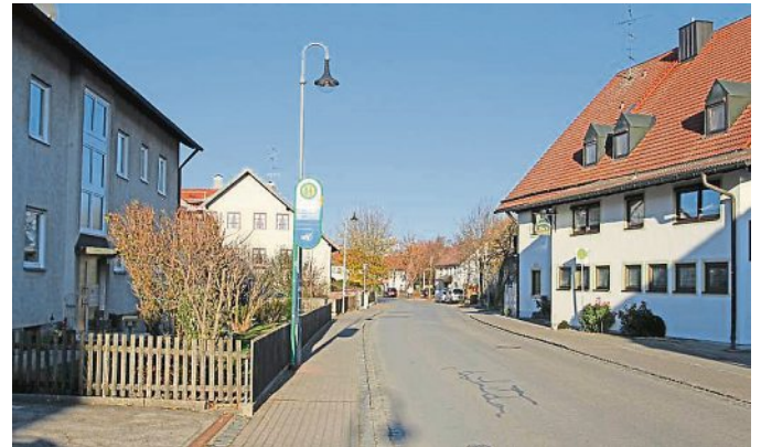
Die Duringstraße heute: Die Kastanienallee ist leider dem modernen Verkehr zum Opfer gefallen.

Wieder hat Gemeindearchivar Dieter Hess eine Fülle an Bildern aus dem Archiv geholt, um die geschichtliche Entwicklung Türkenfelds zu zeigen. In der heutigen Ausgabe zeigen wir Ortsansichten aus Türkenfeld jeweils vor hundert Jahren und heute. Die alten Ansichten stammen aus einem Fotoalbum aus dem Jahr 1917, das der damalige Bürgermeister Schnöller nach seiner Rückkehr aus dem ersten Weltkrieg als Geschenk erhielt.