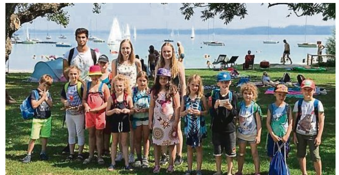
Abwechslungsreiches Programm: Ob am Ammersee...