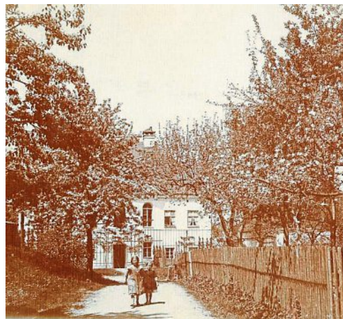
Schloßweg, Richtung Norden: Links auf dem Hügel liegt der alte Friedhof. Im Garten der Käserei blühen die Obstbäume.