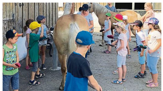
... oder auf dem Pferdehof: