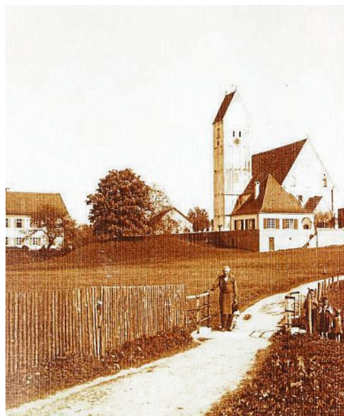
Klammersteinweg, Richtung Südosten: Links das alte Schulhaus und der Schloßberg. Neben dem Kirchturm die Käserei (Linsenmann).