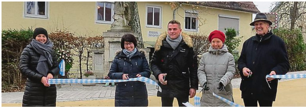
Das Band durchschnitten: Feierlich wurde die neugestaltete Türkenfelder Straße eröffnet.

Die Planung begann im Frühjahr 2016 und wurde in einem intensiven Planungsprozess erarbeitet. Neben der