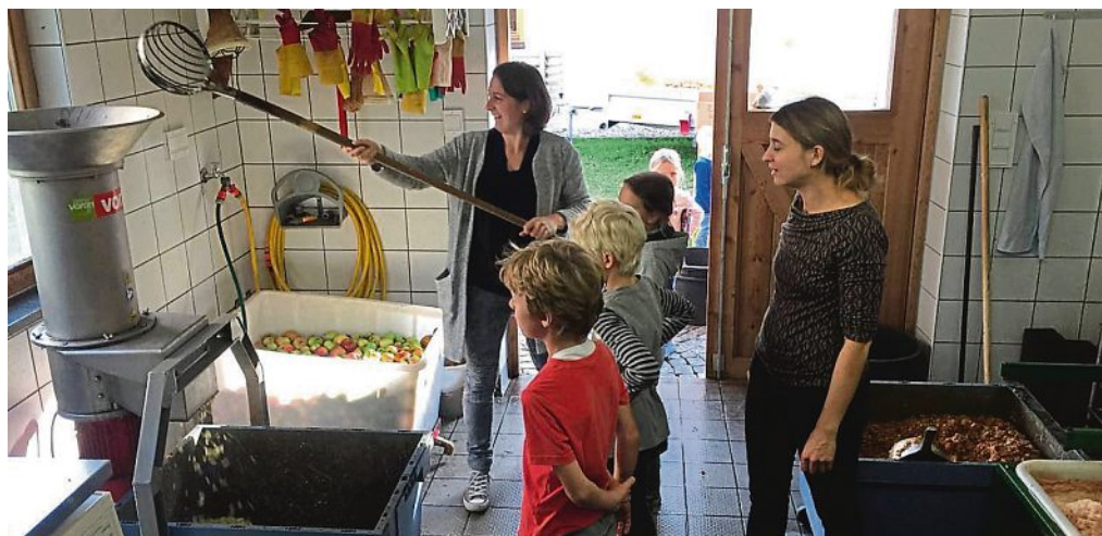
Voller Einsatz: gespannt verfolgen die Kinder das Mosten im Mosthäusl.

Unterstützt wurde der Elternbeirat von den Obstspenden der Eltern und Türkenfelder und dem großen Engagement des Obst- und Gartenbauvereins, der sowohl die Geräte kostenfrei zur Verfügung stellte, die Verpackungen sponsorte, als auch dem Elternbeirat beim Mosten tatkräftig unter die Arme griff.