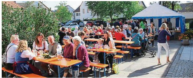
Gut besucht: das Apfel- und Erntefest.

Am 30. September fand bei schönem Herbstwetter unser Apfel- und Erntefest statt. Ob-