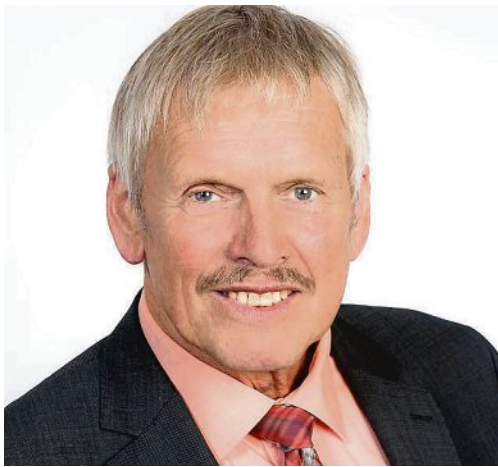
1. Bürgermeister Pius Keller.