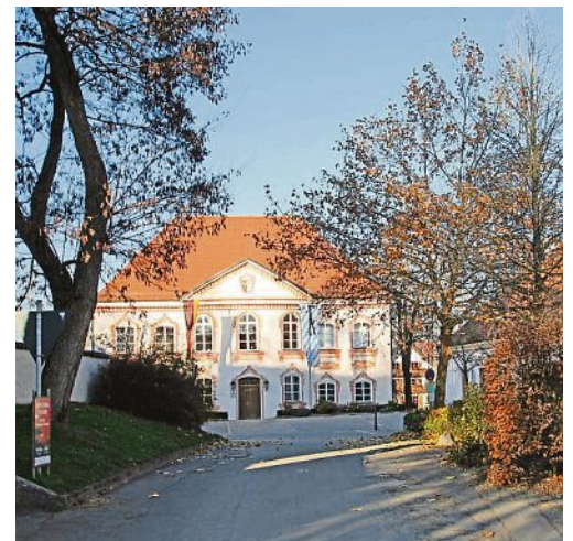
Der Schloßweg heute: Rechts neben dem Schloss steht heute noch das alte Feuerwehrhaus.