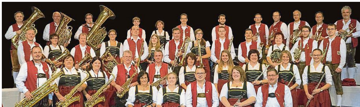
Verwöhnten die Ohren der Zuhörer: Der Musikverein Türkenfeld.