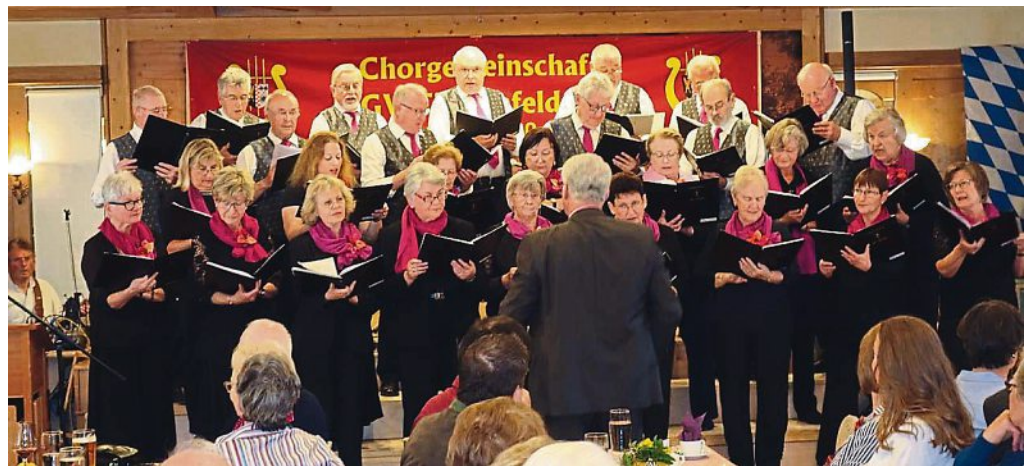
Unterhielten die Gäste vortrefflich: die Chorgemeinschaft Türkenfeld.