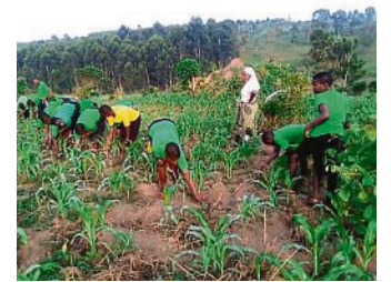
Das eigene Gemüse , hier der von Schülern gepflanzte Mais, liefert einen wesentlichen Beitrag zur Schulverpflegung.

Mit einer Bilanz, die - wieder einmal mehr - für St. Zoe