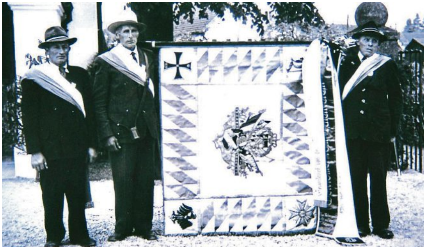
Historischer Moment: Die Gründung des KSV.

Liebe Türkenfelderinnen und Türkenfelder, liebe Freunde des Krieger- und Soldatenvereins Türkenfeld-Zankenhausen,