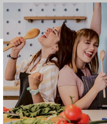
Persönlich. Professionell. Passend.

wieser | 35 JAHRE KÜCHEN | AUS LEIDENSCHAFT ZUR PERFEKTION