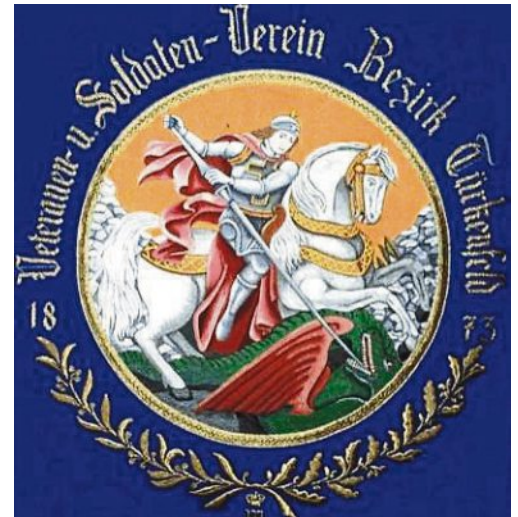
Das Wappen der Gründungsfahne.