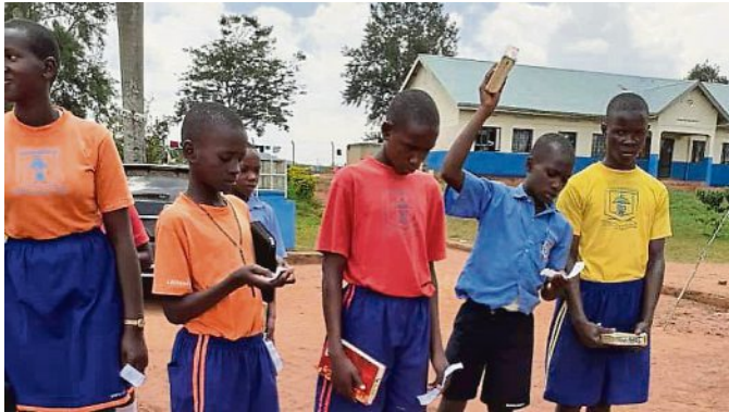
Neue Schüler der Primary School (Grundschule) werden bei einer offiziellen Zeremonie aufgenommen.