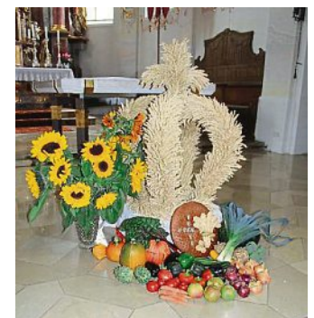
Immer wieder eine Augenweide: der Erntedankaltar.

Martina Ortner Schriftführerin