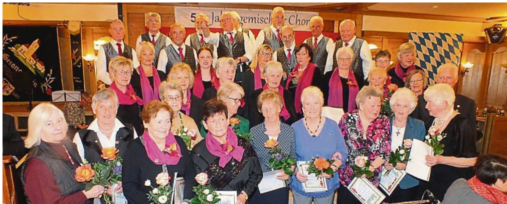
Alle beisammen: der gemischte Chor Türkenfeld. Im Vordergrund die geehrten Gründungsmitglieder.