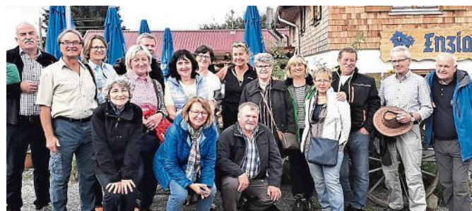
Zu einem ungewöhnlichen Klassentreffen fanden sich ehemalige Türkenfelder Schüler der Jahrgänge 1953 und 1954 zusammen: auf der Alpspitze in Nesselwang.