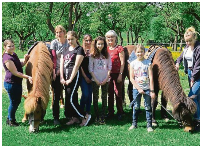
Entspannung vom Lernalltag: Die Schüler machten Mitte des Jahres einen Ausflug zum Pferdehof in Zankenhausen.

Die OGTS ist eine Ganztagschule, bei der über den vorläufigen Unterricht hinaus an mindestens vier Tagen in der Woche eine Freizeit- und Hausaufgabenbetreuung für die Schülerinnen und Schüler stattfindet und ein Mittagessen bereitgestellt wird. Das Angebot unterliegt der Aufsicht und Verantwortung der Schulleitung und wird in Türkenfeld in enger Kooperation mit der Gemeinde durchgeführt. Die offene Ganztagschule beinhaltet: eine qualifizierte Betreuung ab Unterrichtsschluss; ein umfangreiches Freizeitangebot; Mittagsverpflegung (kostenpflichtig); und eine individuelle Lernzeitbetreuung (außer bei der OGTS Grundschule kurz).