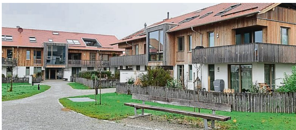
Gelungene Innenentwicklung auf dem Weyarner Klosteranger. Es entstanden auch Mehrgenerationenhäuser.

Gerhard Meißner TG Türkenfeld