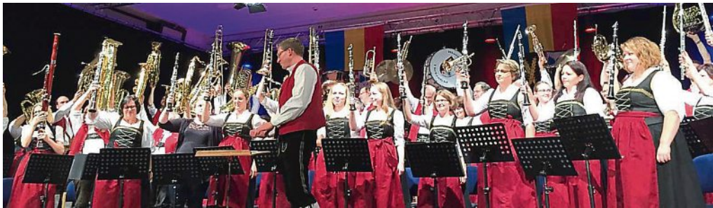
Musik für die Freiheit: Der Musikverein Türkenfeld überzeugte bei seinem Herbstkonzert.

Das diesjährige Herbstkonzert des Musikvereins Türkenfeld stand unter dem Motto Freiheit. Auf verschiedene Arten durchwirkte der Freiheitsbegriff das Konzertprogramm und fesselte musikalisch das Publikum von der ersten bis zur letzten Minute.