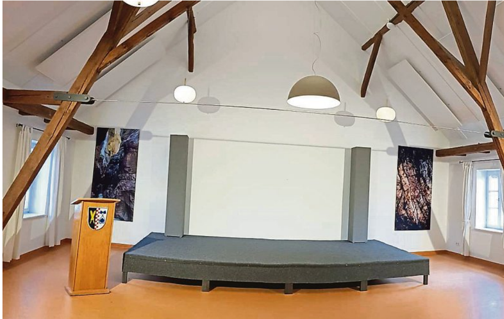
Licht für den Linsenmannsaal: der Gemeinderat beschloss, eine neue Beleuchtung zu installieren und die Akustik zu optimieren.

Der Saal steht nun den örtlichen Vereinen und Institu-