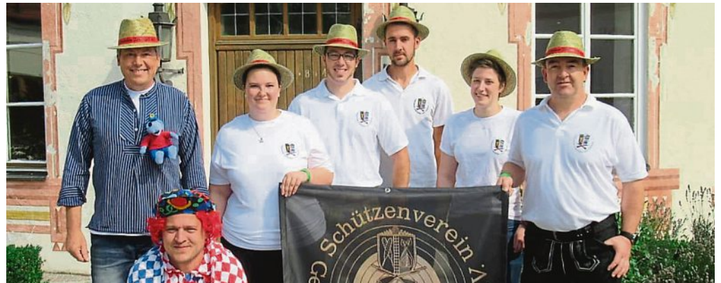
Beim Fischerstechen heuer mit dabei: Mannschaft des Schützenvereins 2019.

Terminreminderung: Unser diesjähriges Königsschießen findet am 27. Dezember 2019 sowie 3. und 10. Januar 2020