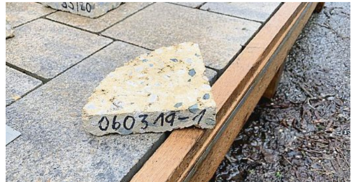
Der Farbasphalt im Dorfczentrum steht fest: Beim gemeinsamen Ortstermin im Februar entschieden sich Gemeinderat und TG-Vorstand für diesen Musterton.

Ursprünglich sollte der anschließende Bereich der Bahnhofstraße (Weiheranfang bis Bahnhofvorplatz) im Jahr 2022 in einem Stück saniert werden. Abzüglich der Zuschüsse durch das ALE hätte