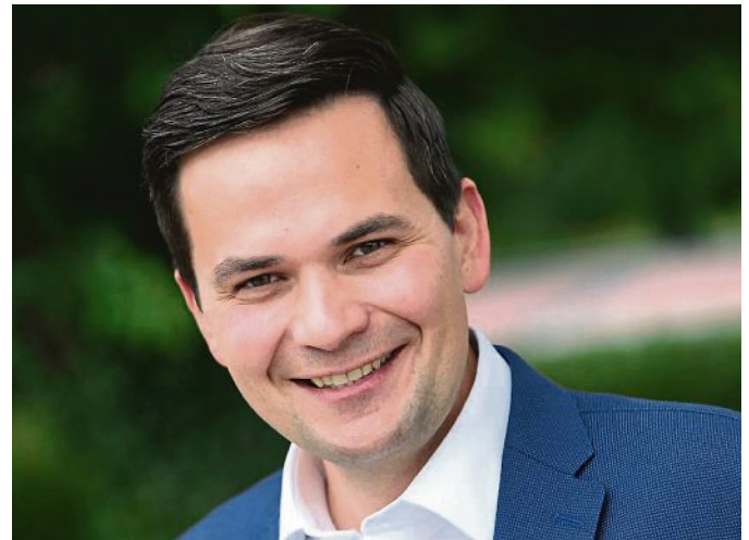
Erster Bürgermeister Emanuel Staffler

Unter anderem damit gelingt es erstmals seit vielen Jahren, den Trend der alljährlich steigenden Personalkosten zu durchbrechen. In Zahlen ausgedrückt wirkt sich dies wie folgt aus (Tarifsteigerungen im Jahr 2021 bereits eingerechnet):