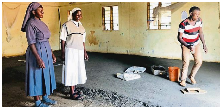
In den Schlafräumen der Internatsschüler wird der Boden erneuert,