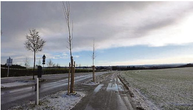
Zwei der neu gepflanzten Bäume stehen am Fahrradweg nach Zankenhausen.

Coronabedingt fanden die beiden Vorstandssitzungen der Teilnehmergeinschaft (TG) im Dezember 2020 und im Februar 2021 als Videokonferenzen statt. Im Mittelpunkt beider Sitzungen stand die Bahnhofstraße mit ihren verschiedenen Bauabschnitten. Darüber hinaus wurde auf der Dezember-Sitzung auch die Kostenvereinbarung zur Sanierung des Rathaussaales beschlossen und eine Bilanz der Pflanzaktion gezogen.