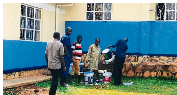
... zusätzlich werden defekte Fenster ausgetauscht.