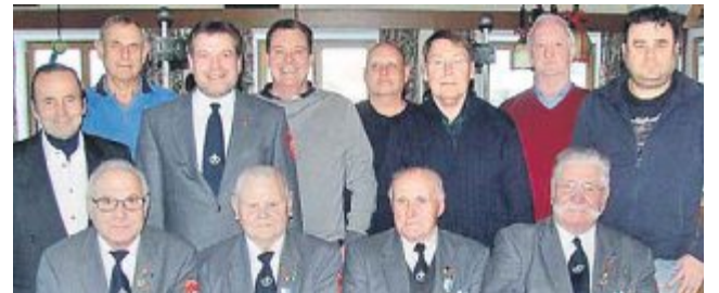
Ehrungen Bei der Jahreshauptversammlung des Krieger- und Soldatenvereins am 07. Januar wurden wieder verdiente Mitglieder geehrt.

Alle Teilnehmer erhalten Medaillen und Urkunden. Für die Sieger gibt es zusätzlich noch Pokale. In der Pause dürfen die kleinen Pilotinnen und Piloten bis 6 Jahren mit dem Bobbycar ihre Geschicklichkeit auf der Rennstrecke zeigen.