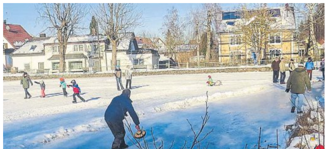
Knackig kalt war der Winter in diesem Jahr. Aber er brachte auch viel Spaß, beim Schlittenfahren am Gollenberg, beim Schlittschuhfahren und Eisstockschießen auf dem Dorfweiher oder bei Spaziergängen durch unsere schöne Winterlandschaft.