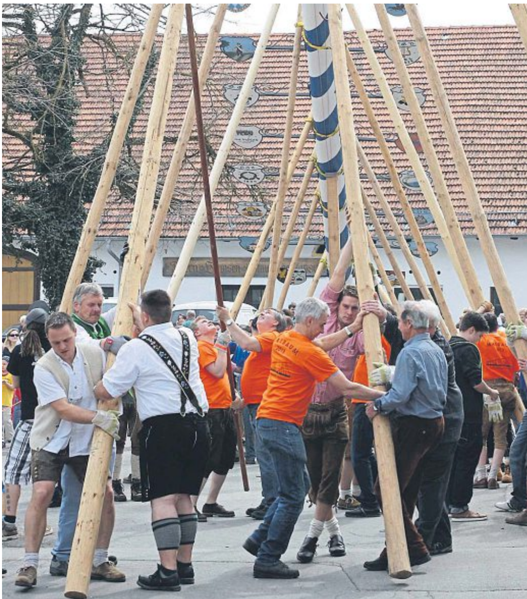
Beweisen Muskelkraft: Beim Aufstellen des Maibaums packen die Türkenfelder alle mit an.

Bereits ab 11 Uhr besteht die Möglichkeit für Gäste und Helfer, sich mit Schweinsbraten oder einer „Türkenfelder-Bratwurst“ (die extra für dieses Fest produziert wird) zu stärken, um dann ab 13 Uhr das Aufstellen des Maibaums zu beobachten oder dabei auch tatkräftig mitzuhelfen. Für Stimmung und gute Laune sorgt die Türkenfelder Blaskapelle.