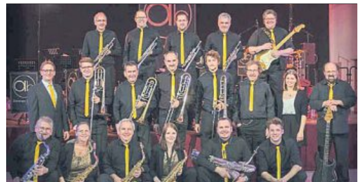
Die Ammer Brass Company überzeugte bei ihrem Konzertdebüt am 14. Januar in der Schönberggaula Türkenfeld mit klanglicher Vielfalt. Die ausgewählten Stücke deckten mindestens ebenso viele Jahrzehnte ab, wie die Mitglieder der neuen Bigband des Musikvereins. Man darf sich darauf freuen, mehr von der Ammer Brass Company zu hören.