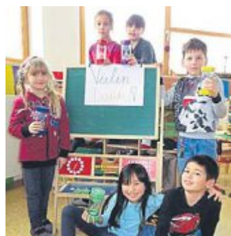
Die Kinder freuen sich schon sehr auf ihre Sanduhren

Der Türkenfelder Kleidertreff besteht mittlerweile seit knapp über einem Jahr und kann eine durchwegs positive Bilanz ziehen. Jeden Donnerstag öffnet der Treff zwischen 17 und 19 Uhr im ersten Stock des Linsenmanngebäudes für alle Bürger, um gut erhaltene Kleidung gegen ei-