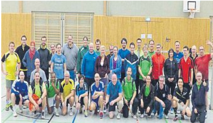
39 Teilnehmer aus unterschiedlichen Landkreisen und Vereinen.

Am 04. Dezember 2016 hat die Badminton-Abteilung zum ersten Mal ein offenes Schleiferlturnier ausgerichtet. Dabei handelt sich um einen besonderen Turniermodus, bei dem weniger der Wettkampf betont wird, sondern der Fokus auf Spaß und abwechslungsreiche Spiele gelegt wird. Daher ist diese Form insbesondere bei Freizeitspielern äußerst beliebt.