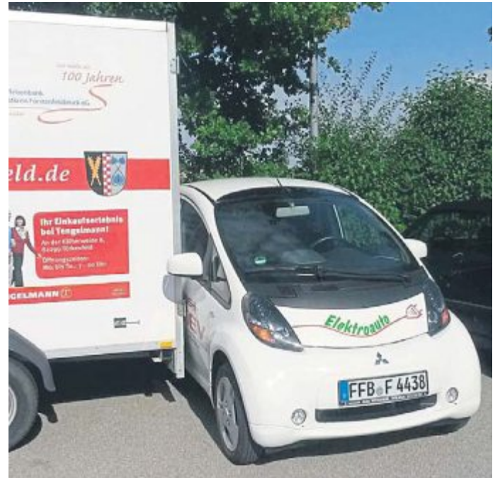
Leistet gute Dienste beim Transport von Instrumenten: Der von örtlichen Firmen gesponsorte Anhänger des Musikvereins.

den betrug 6.531 Euro. Eine Parkkralle, die der Musikverein Türkenfeld nun angebracht hat, soll weitere Sach-