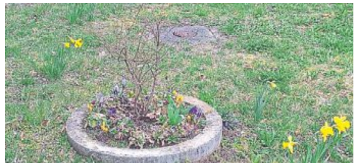
Im Frühling treiben wieder Narzissen und Krokusse, gepflanzt von den Grünanlagenpaten.