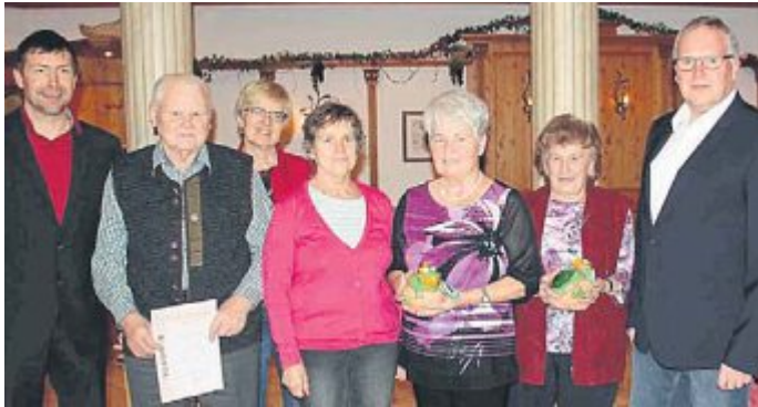
Ehrungen an der Adventsfeier.