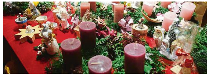
Weihnachtlich festlich: Die Adventsgestecke des Obst- und Gartenbauvereins.

Unsere Fackelwanderung, am Samstag, 21. Januar 2023. Bei Anbruch der Dunkelheit um etwa 17.30 Uhr wird sich der Lichterwurm in Bewegung setzen, und im An-