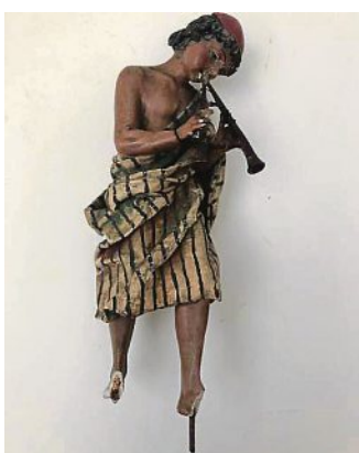
Die Krippenfigur vorher...

Ist das nicht erfreulich? Die Restaurierung unserer Krippenfiguren ist seit Ende Oktober 2022 abgeschlossen! Rechtzeitig zum heurigen Weihnachtsfest erscheint die Krippe im neuen Glanz und der ist ganz offensichtlich. Die Figuren strahlen wieder Leben und Farbe aus. Ein ganz besonderer Dank gebührt „unserer“ Restaurato-