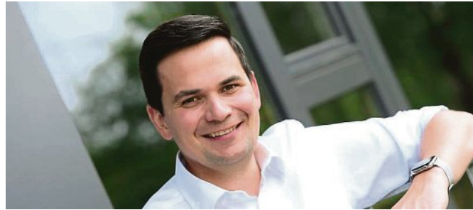
Emanuel Staffler, Erster Bürgermeister.

Mit einer gewissen Dankbarkeit blicke ich auf das zu Ende gehende Jahr zurück. Vieles haben wir erreicht und umsetzen können und ich stelle bewusst nicht einzelne Projekte hier heraus! Das Mitteilungsblatt bietet stets einen schönen „Blick in den Rückspiegel“ und zeigt, was geschaffen wurde. Ich will klar sagen, dass vieles nur deswegen gelingt, weil wir