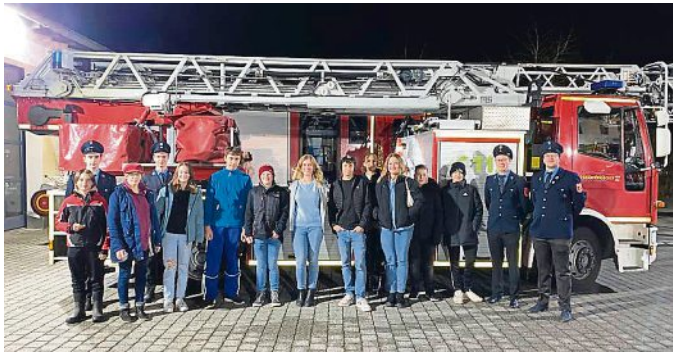
Viele Jugendliche interessieren sich für die Feuerwehr.