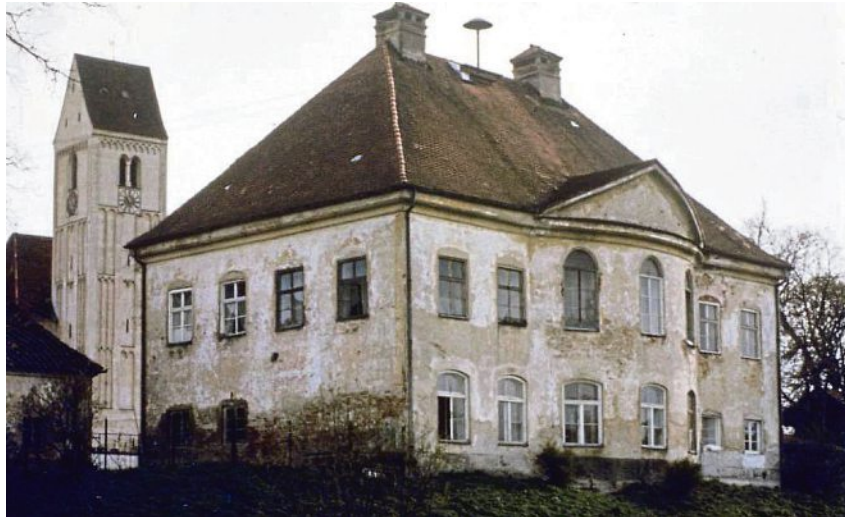
Das Schloss vor der ersten Sanierung. Man sieht deutlich die Spuren der früheren Spalierbäume, die der Fassade zugesetzt haben.