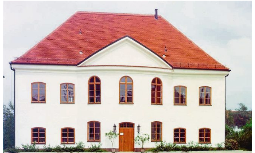
Die Schlossfassade nach der ersten Sanierung. Hier wurden die Malereien überdeckt - so wie das Schloss wohl auch ursprünglich ausgesehen hat.

Wie kaum ein anderes Gebäude steht das historische Fuggerschloss für die Identität unserer Ortschaft. Bei der anstehenden Fassadensanierung hatte der Gemeinderat deshalb eine weitreichende Entscheidung zu treffen: Soll der gewohnte Anblick bleiben oder eine günstigere, historisch womöglich korrektere Variante gewählt werden? So viel gleich vorweg: Es bleibt alles beim Alten - die den meisten Türkenfeldern liebgewordene Bemalung